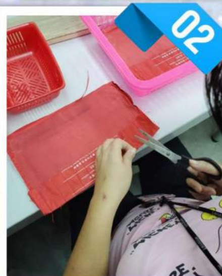
2. 用剪刀對著線頭剪下。