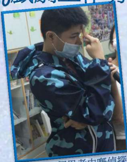
我係一個思考中嘅偵探

11-12 月期間完成 6 節課堂，共有 20 名學員參加，學員學習用身體語言及戲劇表達個人情感，學習過程中學員表現雀躍！