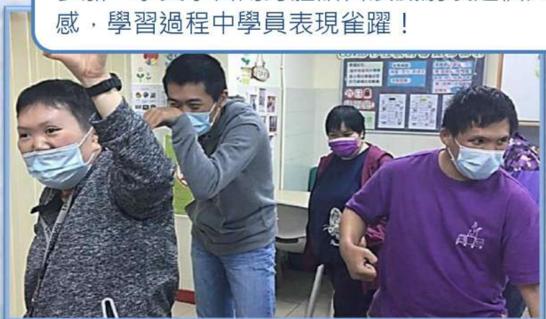
一齊扮鬼臉扮馬好開心！