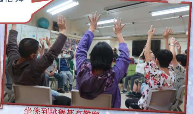
坐係到跳舞都有難度～