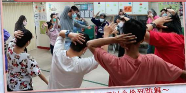
我地可以企係到跳舞～