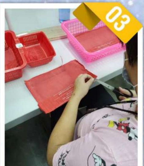
3. 剪至斷線，整齊排放好便完成。